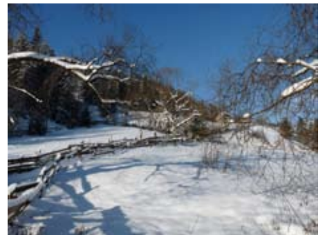
de omgeving van Albac