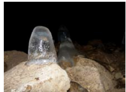
Ghețarul de la Vârtop